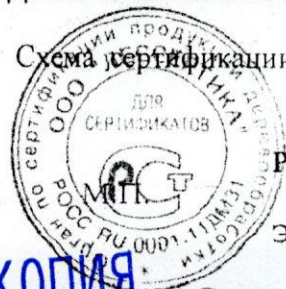
Схема сертификации – Зс по ГОСТ Р 53603-2009